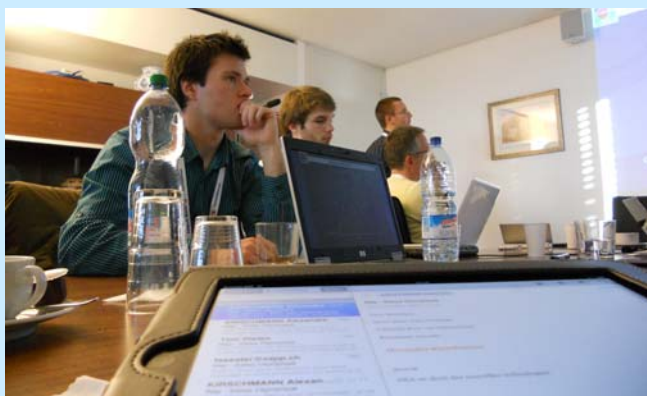
Workshop World Archery